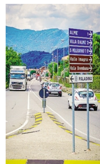
La attuale strada da Paladina verso Villa d'Almè