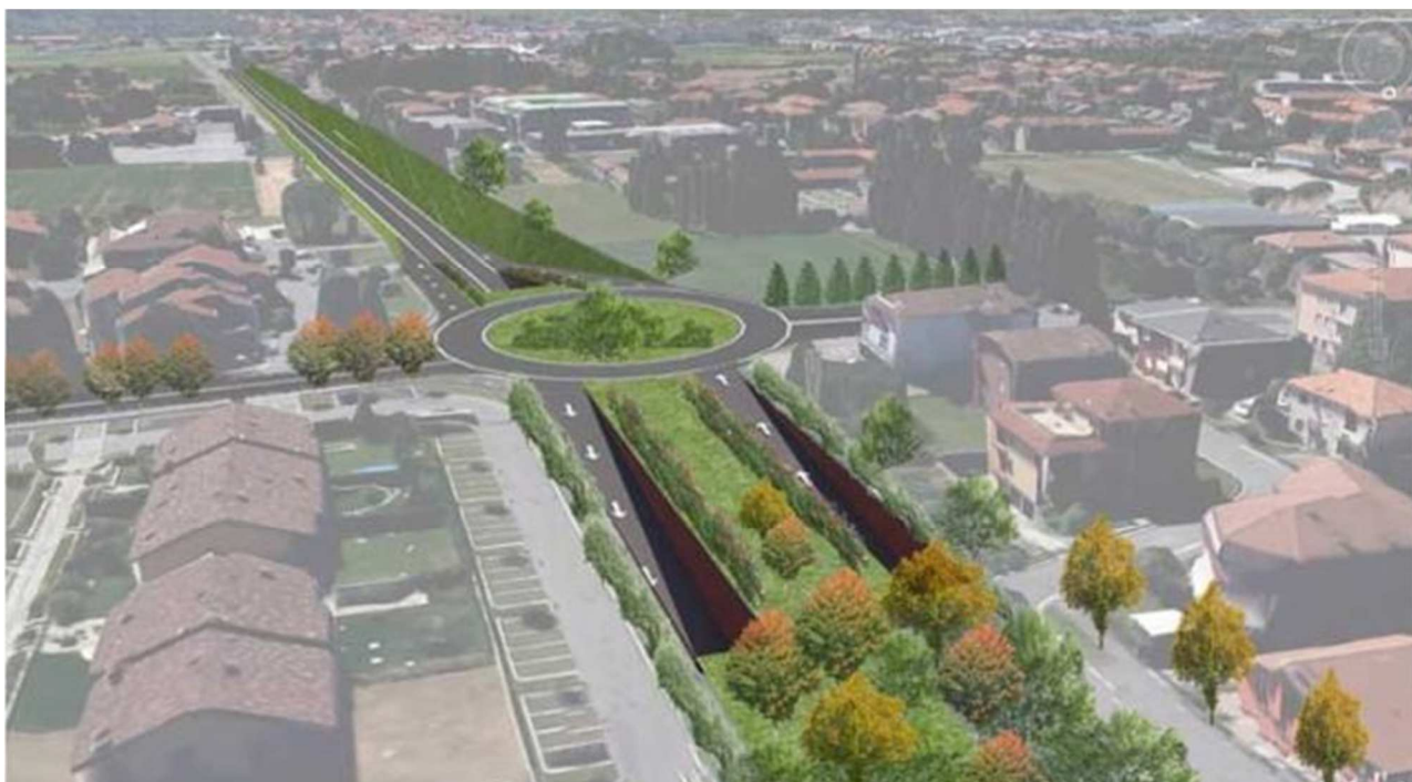
Rendering rotatoria Paladina vista da nord