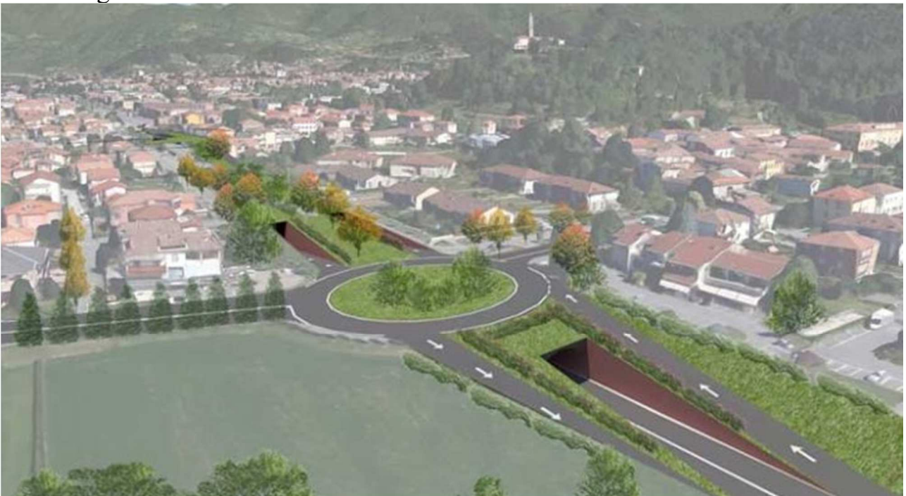
rendering rotatoria Paladina vista da Sud