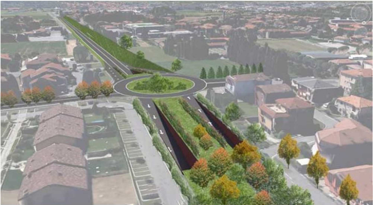
Rendering rotatoria Paladina vista da nord

“rendering”, che illustrano quale sarebbe il risultato nella zona pianeggiante e urbanizzata.