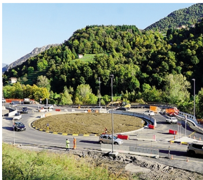
La rotonda ad Ambria durante la realizzazione

Sempre il settore Viabilità della Provincia ha disposto l'istituzione di senso unico alternato regolato da movieri e limite massimo di velocità pari a 30 all'ora lungo la provinciale 16 in Comune di Costa